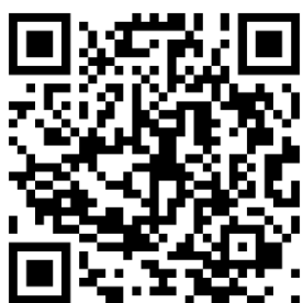
①お申込みはこちら