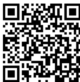
②入金のご連絡はこちら